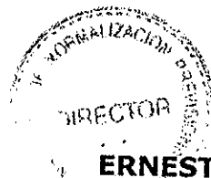
ERNESTO EVANS ESPÍNEIRA. DIRECTOR NACIONAL. INSTITUTO DE NORMALIZACION PREVISIONAL.